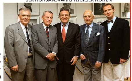
Kafferast på Karolinska