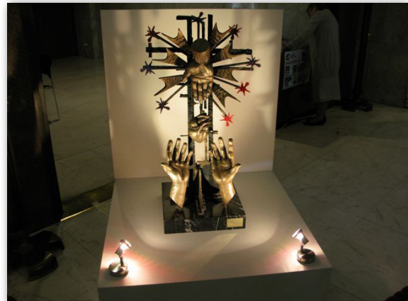
Konstverk utställt i foajén under mötet. Konstnär okänd.