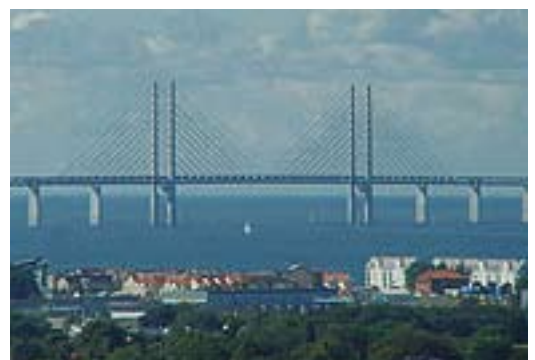
En i dag klassisk vy - Öresundsbron