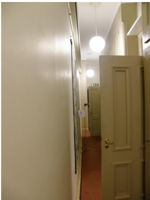
Bild 1: Korridoren på våning 4 med öppna dörrar in till de två kontorsrummen 463 och 464 till vänster.